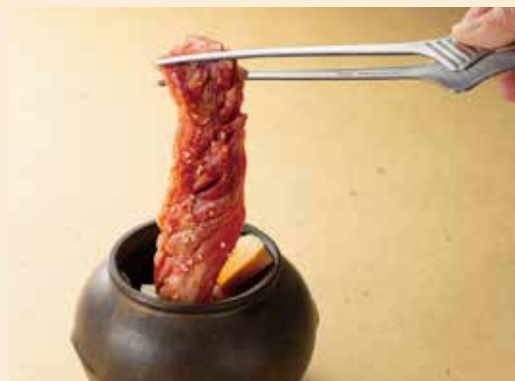
壺漬け中落ちカルビ