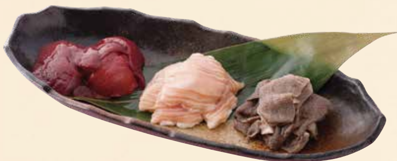
ホルモン3種盛 1,480円(税込1,628円)