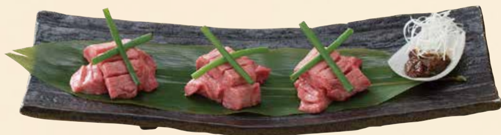
厚切りネギ味噌タン 1,880円(税込2,068円)