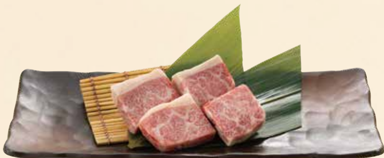
和牛特撰カルビ 1,880円(税込2,068円)