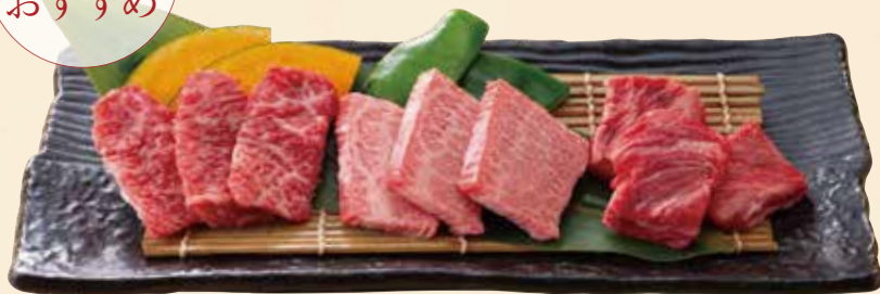
カルビ3種盛 (暁カルビ・和牛上カルビ・中落ちカルビ) 2,180円(税込2,398円)