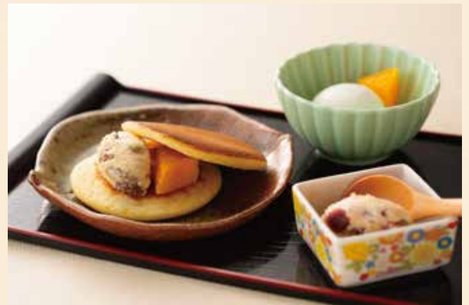
チーズどら焼きとヨーグルトシャーベット 680円(税込748円)