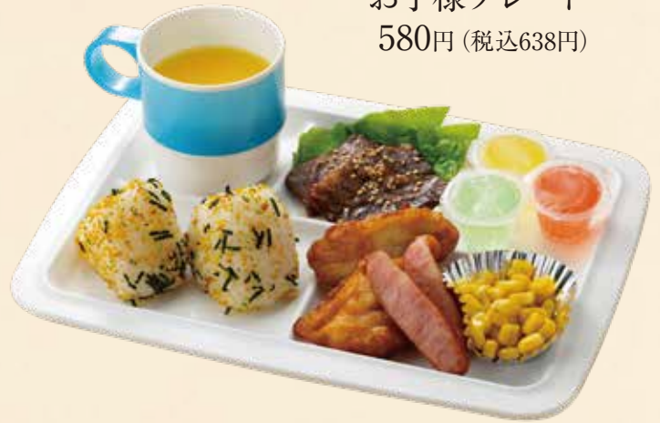
お子様プレート 580円(税込638円)