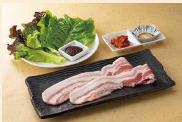
サムギョプサル 1,280円 (税込1,408円) 豚バラを焼き、食べやすくカットして包野菜で包み薬味とともにお召し上がりください。豚バラは、博多すい〜とんを使用しております。