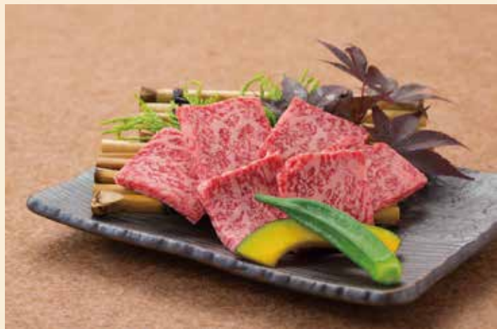
和牛特撰ロース 2,080円(税込2,288円)