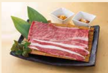
本日の炙りしゃぶ2種盛 2,680円 (税込2,948円)