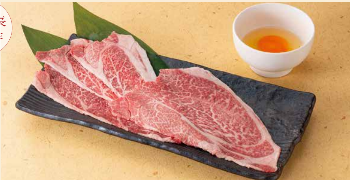
暁自慢の和牛赤身焼きすき 2,080円 (税込2,288円)