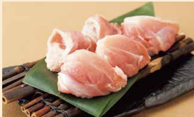
はかた地どり 880円 (税込968円) 博多の地鶏モモのうま味をお楽しみください。