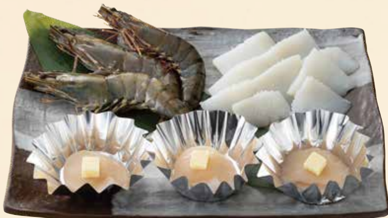
海鮮盛合せ 2,280円 (税込2,508円)